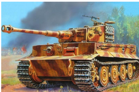
Немецкий танк Тигр