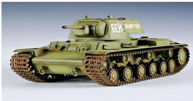
Советский танк КВ - 1