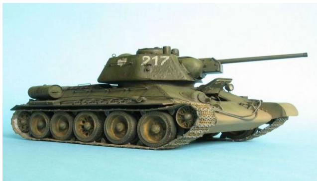
Советский танк Т - 34