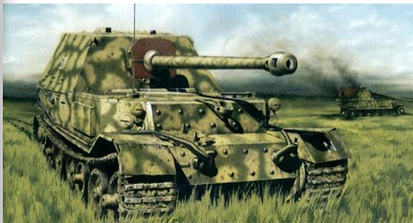
Немецкий танк Фердинанд