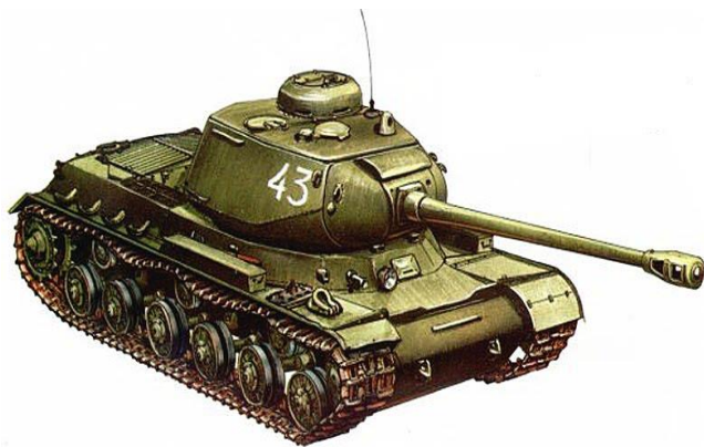
Советский танк ИС - 1