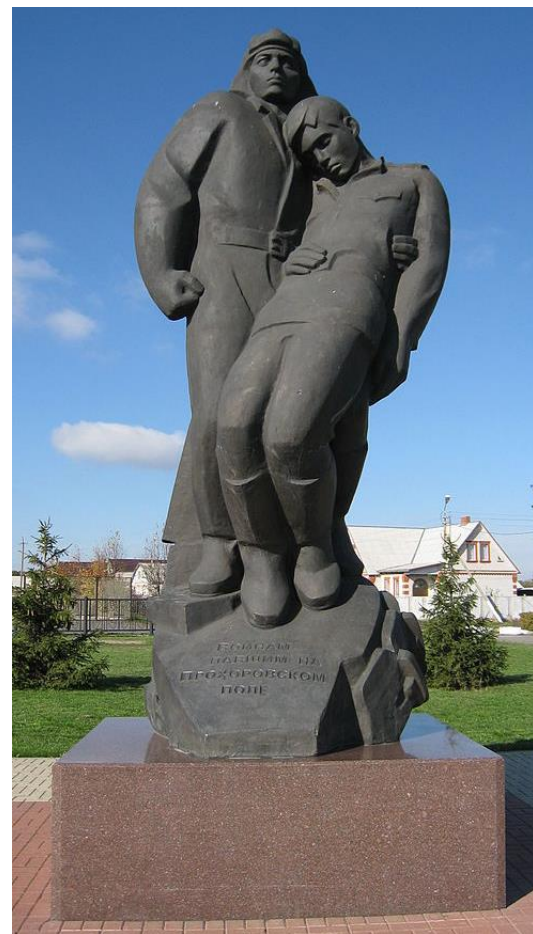
Памятник Танкисту и Пехотинцу на Прохоровском поле